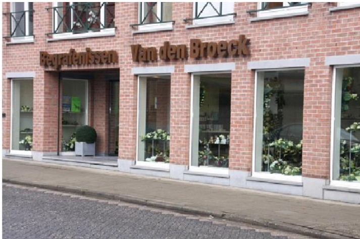
Begravenissen - Crematies - Funerarium Riemenstraat 1-3 2290 Vorselaar - 014/88.16.96