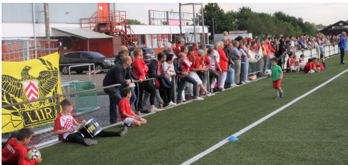
De grote supportersschare op de openingsfinale – woensdagavond

Woensdagnamiddag diende al snel alle voorbereidingen getroffen omdat om 19u een vooruitgeschoven wedstrijd plaats vond. Verschillende spelertjes van Rita Berlaar vierden op donderdag hun 1 ste communie en werd Lyra-Lierse bereid gevonden om hun finale U8 een dag vroeger te betwisten. Naast een schitterende en spannende wedstrijd, waarin R.Berlaar de winst opstreek, was deze match alvast voor onze vereniging een stevige start van de finaledag. De meer dan 120 toeschouwers zorgden ervoor dat ons hamburgerkraam vroegtijdig dienden gesloten, kende de tombola een goede start en mochten we in de kantine alvast niet klagen.