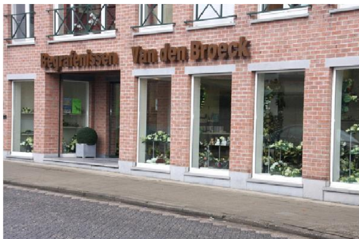
Begravenissen - Crematies - Funerarium Riemenstraat 1-3 2290 Vorselaar - 014/88.16.96