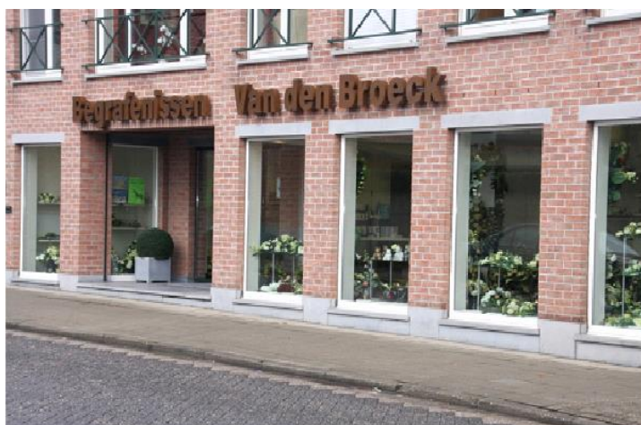
Begrafenissen - Crematies - Funerarium Riemenstraat 1-3 2290 Vorselaar - 014/88.16.96